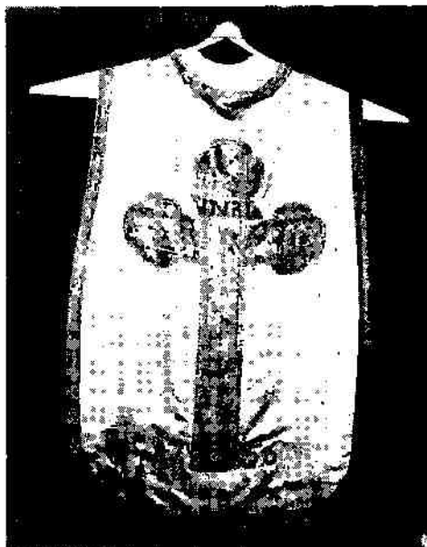
Mässhake med årtaler 1756. Kapellets första mässhake.