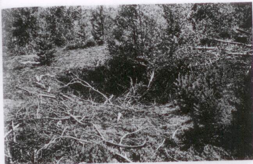
Fångtgrop på Mattiskammen i Nyliden. Gropens form och storlek visar en typisk »älggrop».

De flesta i förteckningen upptagna groparna ha med säkerhet använts för fångst av björn och älg, möjligen även för vargfångst. Rimligtvis bör de ha tillkommit under 1400–1700-talen och nyttjats av befolkningen i de äldsta byarna, som då var unga och kunde räknas som nybyggen. Måne de är ännu äldre och har grävts av kringströvande jägare? Några sägner eller skriftliga uppgifter finns ej bevarade.