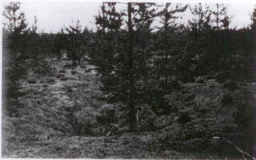
Fångstgrop på Vacksundsmon.

ger på dessa ställen i vägen för deras otroligt snabba lopp. Torneå lappmark lämnar dessutom det bästa vinterbetet – renmossan, som växer där frodig och ymnig. Uti de mellersta lappmarkerna åter är dels jordmånen mindre passande för denna lavart, som fordrar en torr och sandig jord, dels är de bästa renbetesland uppbrända av nybyggare, vilka därigenom söka avlägsna lapparna med dess renhjordar från sitt gebit, emedan dessa ofta göra skada på nybyggarnas höstackar. Utomdess finns i dessa lappmarker stora och vidsträckta barrskogar, varest snön samlar sig till ansenligt djup, vilken omständighet underlättar jakten för skidlöparen. Det synes sannolikt, att de vilda renar, som fordom funnits, efterhand blivit dödade av skidlöpare. Detta djur är även för varsamt för att intränga uti snödiga skogar, varest det känner sig sakna tillräckligt spelrum för sina fötter och utrymme för sina horn. Vilda renen uppehåller sig uti lägre liggande områden om sommaren, under samma tid således som lapparna vistas med sina tama renar på de högsta fjällen och vid norska skärgården. Om vintern åter, då lapparna återkomma ned till skogarna, fly de vilda renarna därifrån och bege sig högre upp i fjällen.