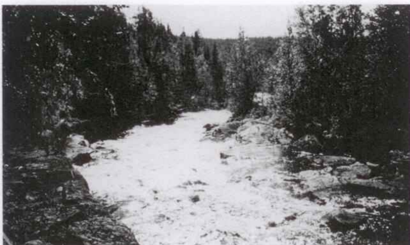
Parti av Spångforsen i Flärkån med vacker stenkista till vänster.

vid Nydammen, varifrån virket flottades via rännor och spakvatten till nästa damm – Mörttjärndammen. Så fortgick det undan för undan med rationell fördelning av arbetet, de yngre och mera förfarna flottarna placerades, där förhållandena var kinkiga, andra placerades att mata in virket i de många timmerrännorna, och en och annan minderårig fick sitta som rännvakt för att meddela flottarna ovanför rännan om virket »brötat» ihop sig nedanför den. Då gick det ej att släppa mer virke i rännan förrän bröten lossats. Så fortgick arbetet, ibland både dag och natt, ty det gällde att passa både väder och vind. Särskilt besvärligt var det, om det blev motvind i selen. Då blev det att invänta natten, då blåsten i allmänhet avtog. Efter som flottningen fortskred, rensades stränderna från virke, och om allt gick bra, så var flottningen över på 7–8 dygn, då den sista stocken av »rumpan» (d. v. s. det strandrensade virket) gick ut i Gideälven vid Gidenäset.