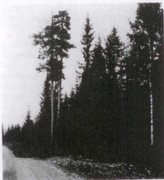
»Adam och Eva» är två tallar av anseelig storlek intill landsvägen Locksta-Lägsta, vilka Kronan låtit fridlysa.

Under den utpräglade bytes- eller självhushållningens tid, låt oss säga under 1800-talet, då kontanta medel var ringa räknat i riksdaler, skilling, styver och runstycken, gällde det att dra sig fram på vad den egna gården, jakten och fisket kunde ge. Ett led i denna