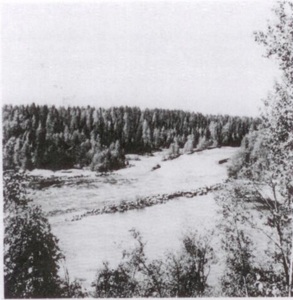
Björnforsen i Gide älv med det gamla laxfisket »Krokagga» nedanför forsen.