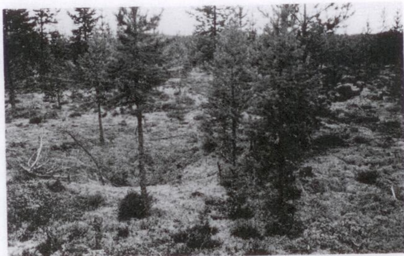
På Vacksundsmon mellan Nyliden och Studsviken finns ett stort antal fångstgropar systematiskt placerade.

Mörtsjö och Uttersjö skogar, ävenså på Hemsjö, Remmarn och Stavs- sjö skogar, bara för att nämna några byaskogar.