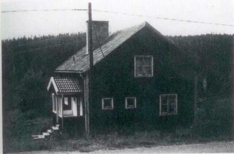
Det mittersta torpet i Norrtjärn.