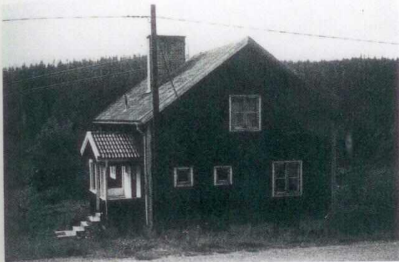
Det mittersta torpet i Norrtjärn.