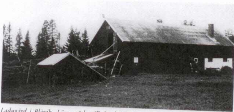
Ladugård i Blåvik. Lägg märke till den hässjade torven, som skall bli till strö under kreaturen.

torkning. Den skulle bli till torvströ i ladugården, vilket enbart det vittnade om stort intresse för jordbruket.