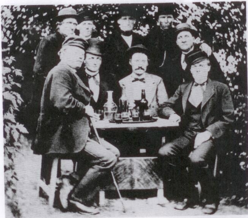
Rallarna var ett robust släkte, och förhållandet till den bofasta befolkningen var i allmänhet gott. Efter arbetsveckans slut »slog man sig lös». Bilden från Björna i början av 1890-talet, där även några björnabor återfinnes. Namnen är okända.

I slutskedet stod dessa två alternativ mot varandra, vilket framgår av Kungl. Maj:ts proposition till riksdagen angående anslag till stambana genom övre Norrland av den 29/1 1886. Det framhölls, att det sista alternativet, den s. k. Gideålinjen, skulle bli både kortare och billigare. Vid riksdagsbehandlingen kom dock militärpolitiska hänsyn att väga så tungt, att Björnalinjen segrade.