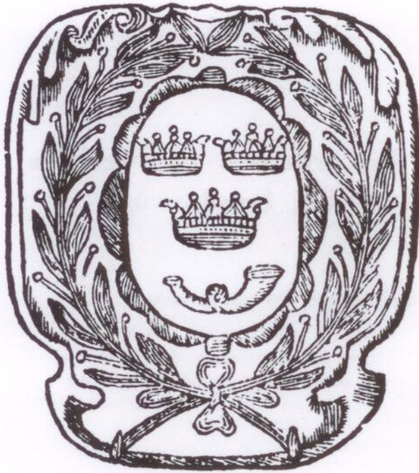
Vapenbricka att bäras på bröstet av postdrängen. Från slutet av 1600-talet.