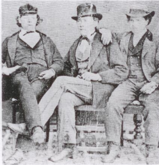
Timmerkörare från Värmland.